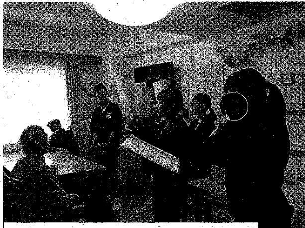
高齢者福祉施設での様々な体験活動