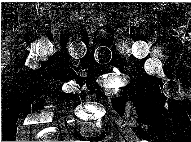
野外での夕食づくり