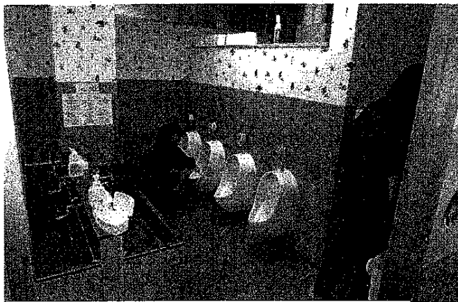
あきた中央保育園：子ども用トイレの清掃