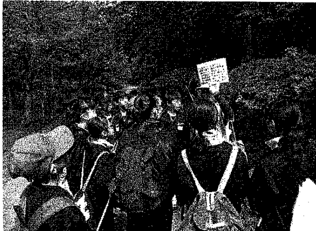
講師の方の説明を聞きながら行った自然観察