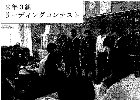
2年3組 リーディングコンテスト

先日の学年・学級PTAでの授業参観ありがとうございました。各学級とも、多数の保護者の皆様にご参観いただきました。新しい学級で、新しい先生や友達とともにいった授業はいかがでしたでしょうか。授業の様子をぜひご家庭でも話題にし、親子の会話を充実させていただければと思います。