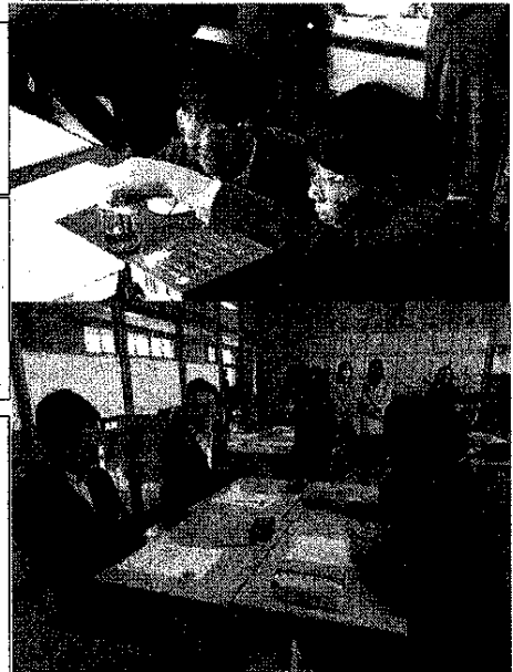
3年1組 電解質の水溶液中で起こる変化

先生の話が分かりやすく、古典を使って子ども達の感性を引き出していて、授業を聞いていて楽しかったです。古語を使って文を作るのは難しいとは思いましたが、それぞれ、自分の好きな季節や時間を興味をもって詠んでいました。