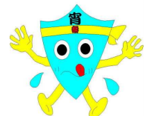
土小みなと宵々祭 イメージキャラクター 宵まつくん

○「人の絆」のすばらしさを実感できるよう、地域で活躍する方や地域にある施設・機関をはじめとする各方面の方々とかかわり合う活動を工夫します。